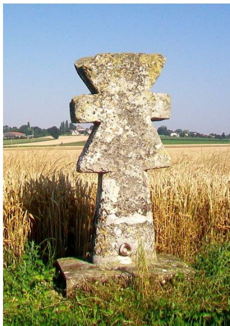
CROIX PATTÉE DU VEXIN